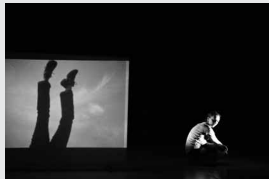
„I Saw What I Thought I Should See“

If I assumed that movement functions similar to texts and that bodies form words to sentences, I would say that I am less interested in their contents and messages than in all the levels underneath and in between. I try to break open the initial form of the conversation and to zoom into the staged moment – like a constant search for the gap. This process inevitably leads to a kind of reduction, not in the sense of leaving something out, but in highlighting or to say it better in extraction.